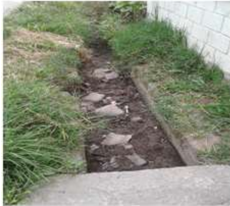
Ilustración 5. Amenazas naturales, construcciones fuera del área permitida, Sector Barrio La Primavera