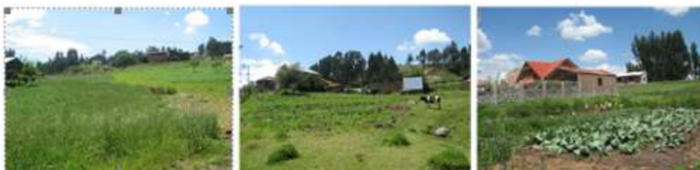
Ilustración 12. Áreas de Cultivos. Vista Barrio La Primavera, Sector Rancho Grande

La actividad pecuaria es una fuente importante de ingresos para las familias de la Parroquia Ricaurte, ya que parte de su producción se destina para la venta. De acuerdo a su importancia se ha determinado que los cuyes son la principal especie animal criada en la parroquia, luego se encuentran las aves (pollos y gallinas), luego están el ganado vacuno, los cerdos y finalmente las ovejas.