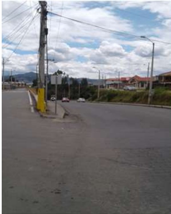
Ilustración 17. Construcción de vía alternativa para el transporte público, Línea 10 de Transporte Urbano