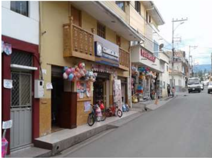
Ilustración 11. Barrio Las Mercedes, zona con mayores áreas productivas