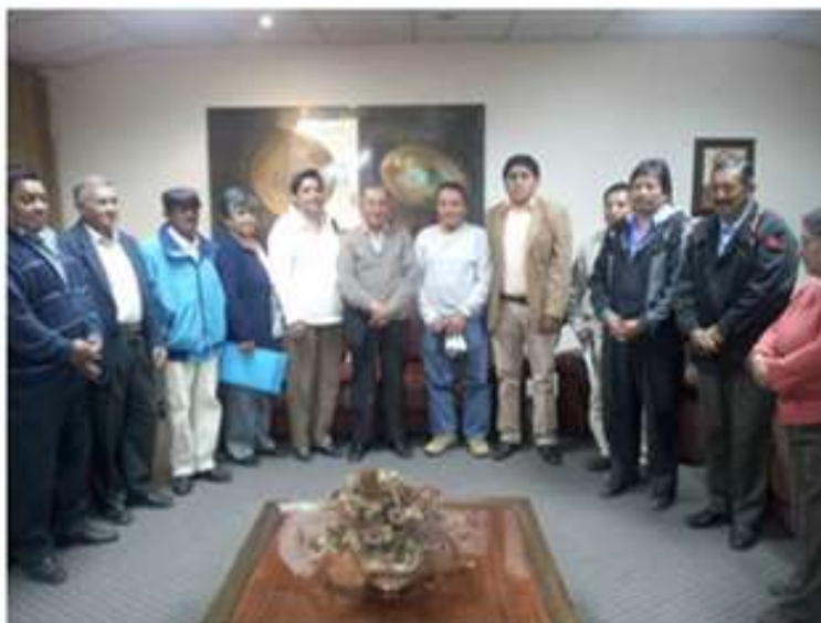
Ilustración 21. Diálogo participativo para conocer las necesidades barriales, Sede GAD parroquial