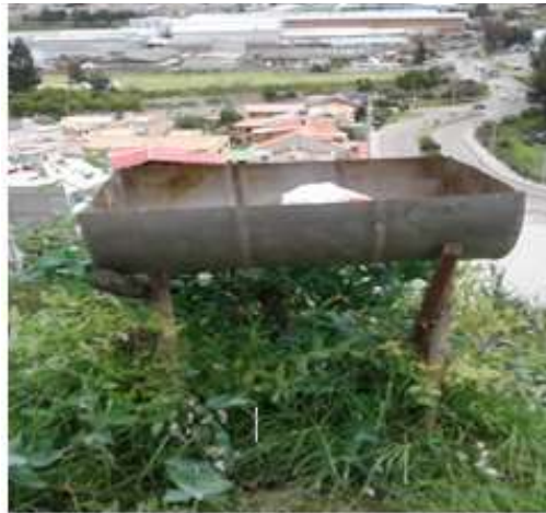
Ilustración 2. Contaminación del Ecosistema por alta presencia de la Zona Industrial