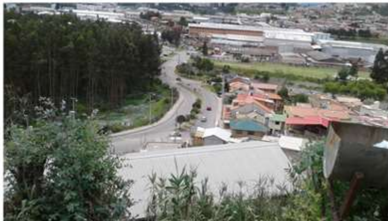
Ilustración 3. Amenazas Naturales, construcciones en zonas de alto riesgo