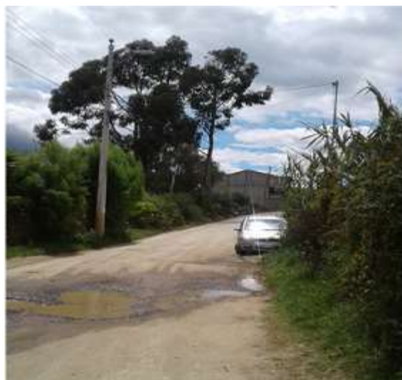
Ilustración 20. Redes viales aún en mal estado, falta de presupuesto para su ejecución. Visita Barrio Abdón Calderón