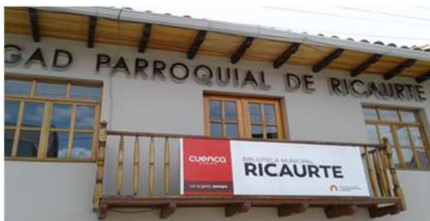
Ilustración 6. Sede del GAD, lugar de concentración y participación política