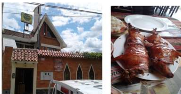
Ilustración 14. Fiesta de San Carlos, patrón de la Parroquia