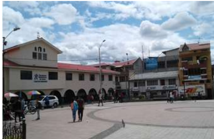
Ilustración 8. Según datos del GAD, la mayor parte de obras son producto del trabajo del GAD como tal, en conjunto con su gente