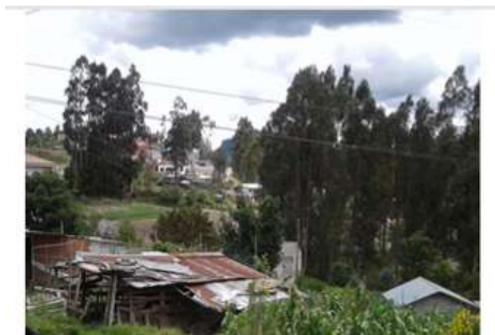
Ilustración 16. Viviendas ubicadas en pendientes, alto riesgo. Falta de apoyo del ente cantonal para el ordenamiento