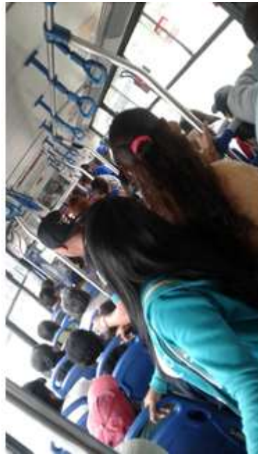
Ilustración 19. Principal línea de transporte desde el casco urbano de la ciudad, hasta la parroquia. Visita parada II Sector El Arenal